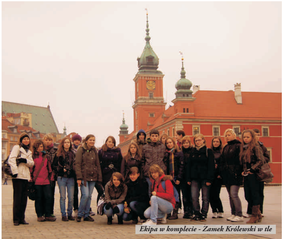
Ekipa w komplecie - Zamek Królewski w tle

tekst i foto: Sylwia Flis (uczennica Zespołu Szkół im. Ignacego Łukasiewicza w Nowej Sarzynie)