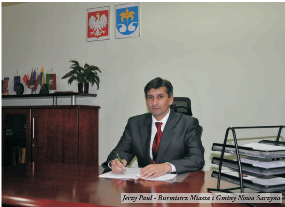
Jerzy Paul - Burmistrz Miasta i Gminy Nowa Sarzyna

J.P.: Będziemy starać się pozyskiwać środki zewnętrzne na realizację naszych przedsięwzięć i inwestycji. Niestety środki zabezpieczone na lata 2007-2013 w większości są już