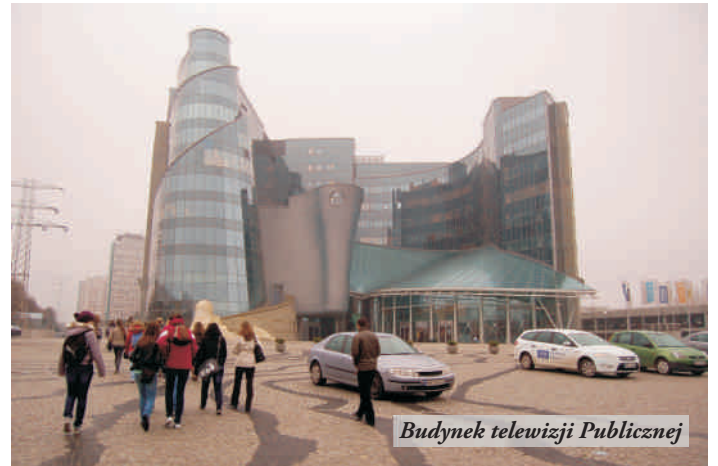
Budynek telewizji Publicznej

O tym, że nowoczesne może być nie tylko Centrum Nauki, ale i muzeum mogliśmy się przekonać w Muzeum Fryderyka Chopina. Multimedia, ciekawa aranżacja wnętrza, to tylko wybrane, zaskakujące pomysły przyświecające twórcom tego miejsca, "reklamującego" dorobek naszego największego kompozytora. Szczególnym zainteresowaniem cieszyły się książki interaktywne, które były zaopatrzone