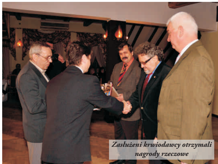
Zasłużeni krwiodawcy otrzymali nagrody rzeczowe