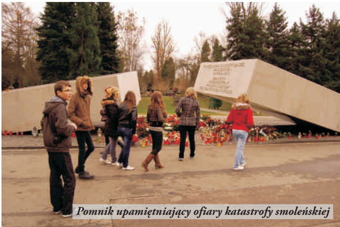
Pomnik upamiętniający ofiary katastrofy smoleńskiej

Ważne dla nas, jako dla potencjalnych, przyszłych dziennikarzy czy ludzi chcących znać