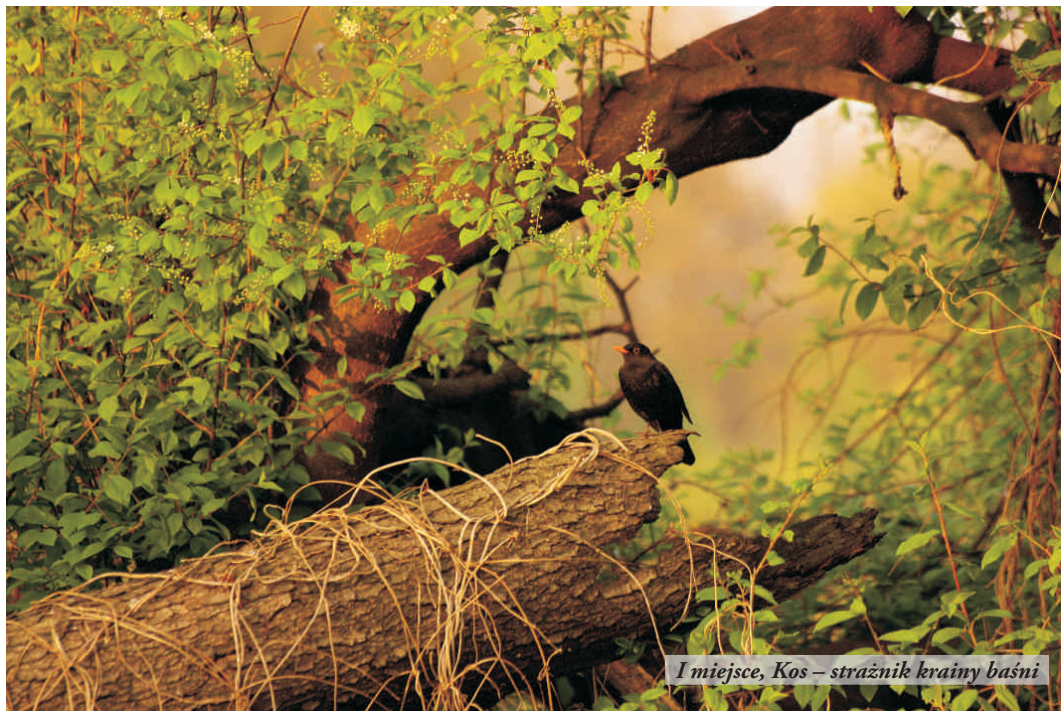
I miejsce, Kos – strażnik krainy baśni

Konkurs “Złap zająca”, którego pomysłodawcą jest firma ZAK SA, polega na ciekawym ujęciu w obiektywie aparatu unikalnych chwil z życia fauny i flory na terenie naszego kraju. Do tegorocznej, czwartej już edycji, zgłosili się pracownicy 19 firm w Polsce, m.in. z Zakładów Chemicznych “Organika Sarzyna” SA. Patronat honorowy nad IV edycją konkursu sprawował ponownie Związek Polskich Fotografów Przyrody. Patronat medialny objęli: magazyn poświęcony fotografii przyrodniczej Foto Natura, portal wszystkich fotografujących Fotal.pl, Polskie Towarzystwo Ochrony Przyrody SALA-